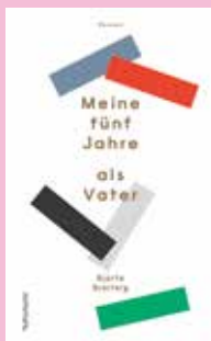
Meine fünf Jahre als Vater (Roman, 2016) ISBN 978-3-902844-59-0