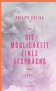
Die Möglichkeit eines Gesprächs (Roman, 2017) ISBN 978-3-902844-97-2