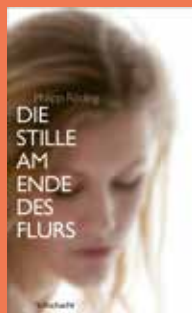
Die Stille am Ende des Flurs (Erzählungen, 2013) ISBN 978-3-902844-26-2