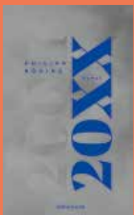
20XX (Roman 2020) ISBN 978-3-903081-39-0