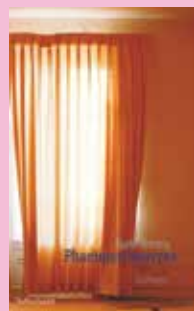
Phantomschmerzen (Erzählungen, 2013) ISBN 978-3-902844-17-0