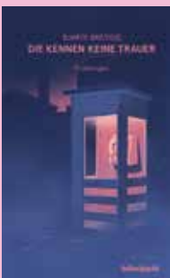
Die kennen keine Trauer (Erzählungen 2019) ISBN 978-3-903081-32-1