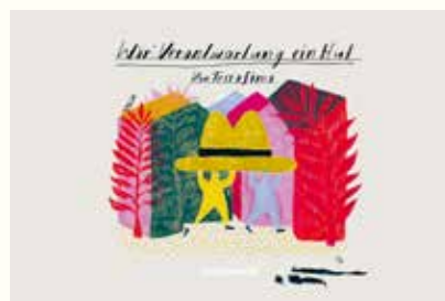
Wär' Verantwortung ein Hut (Bilderbuch 2023) ISBN 978-3-903422-31-5