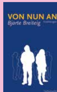
Von nun an (Erzählungen, 2010) ISBN 978-3-902573-52-6